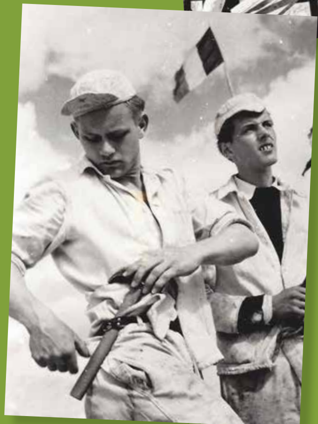
Bouwgezellen in 1957