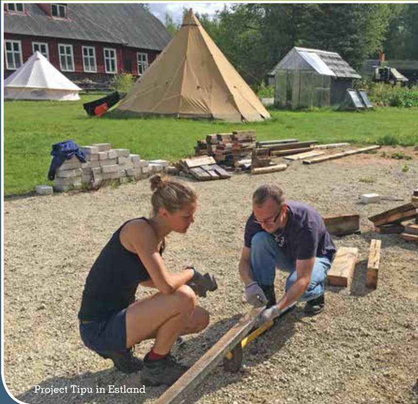
Project Tipu in Estland

De projecten voor 2019 staan op de website. Je kunt bijvoorbeeld een school schilderen in België, klussen in een sloppenwijk in Brazilië, en natuurschool bouwen in Estland, een vakantie voor gehandicapte kinderen organiseren in Kroatië, een weg helpen aanleggen in Marokko, een middelbare school bouwen in Nepal en nog veel meer! Kijk, kies en schrijf je in via www.ibo-nederland.org/projecten/overzicht .