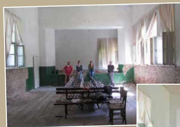
De theaterzaal voor en na de opknapbeurt.

Er werd geweldig voor ons gezorgd, het eten was fantastisch en we werden overal mee naartoe genomen. Je leert een heel nieuwe cultuur kennen, je ontmoet nieuwe mensen, je creëert je eigen leven in een dorpje zonder wifi en supermarkt en je raakt geïnspireerd door al het nieuwe om je heen. Ik was onder de indruk van het enorm positieve effect dat het festival heeft op de lokale bevolking, een normaal bijna leeg dorp - er wonen nog maar 40 ouderen, alle jongeren zijn naar de grote stad vertrokken - komt volledig tot leven. Wat mijn ervaring compleet maakte was het feit dat de organisatoren van het festival de laatste dag meldden dat ze de vrijwilligers zo ontzettend dankbaar waren voor het inspirerende werk dat we hebben gedaan, daardoor voelde ik me ontzettend vereerd, nuttig en ook dankbaar.